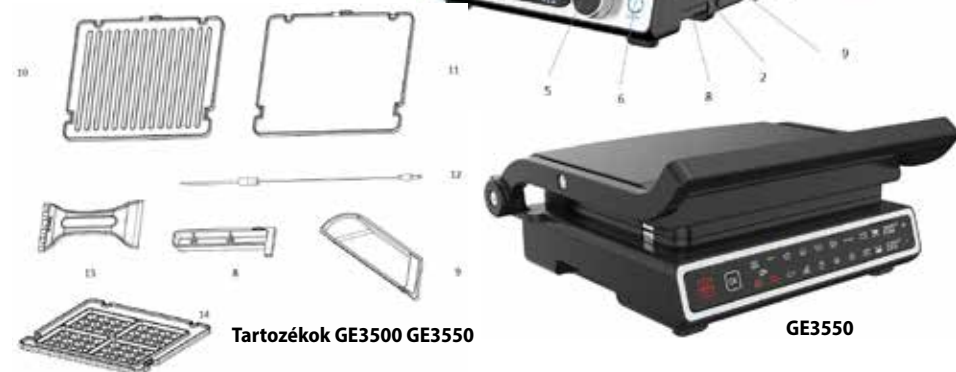
Tartozékok GE3500 GE3550