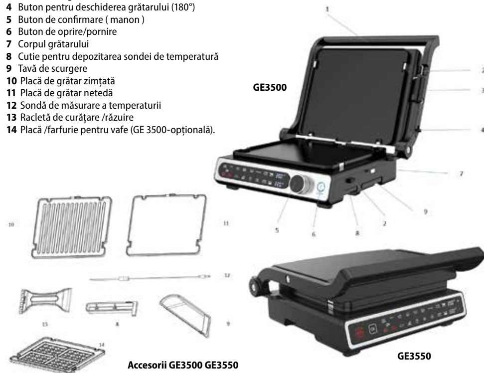
Accesorii GE3500 GE3550