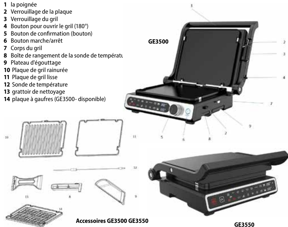
Accessoires GE3500 GE3550