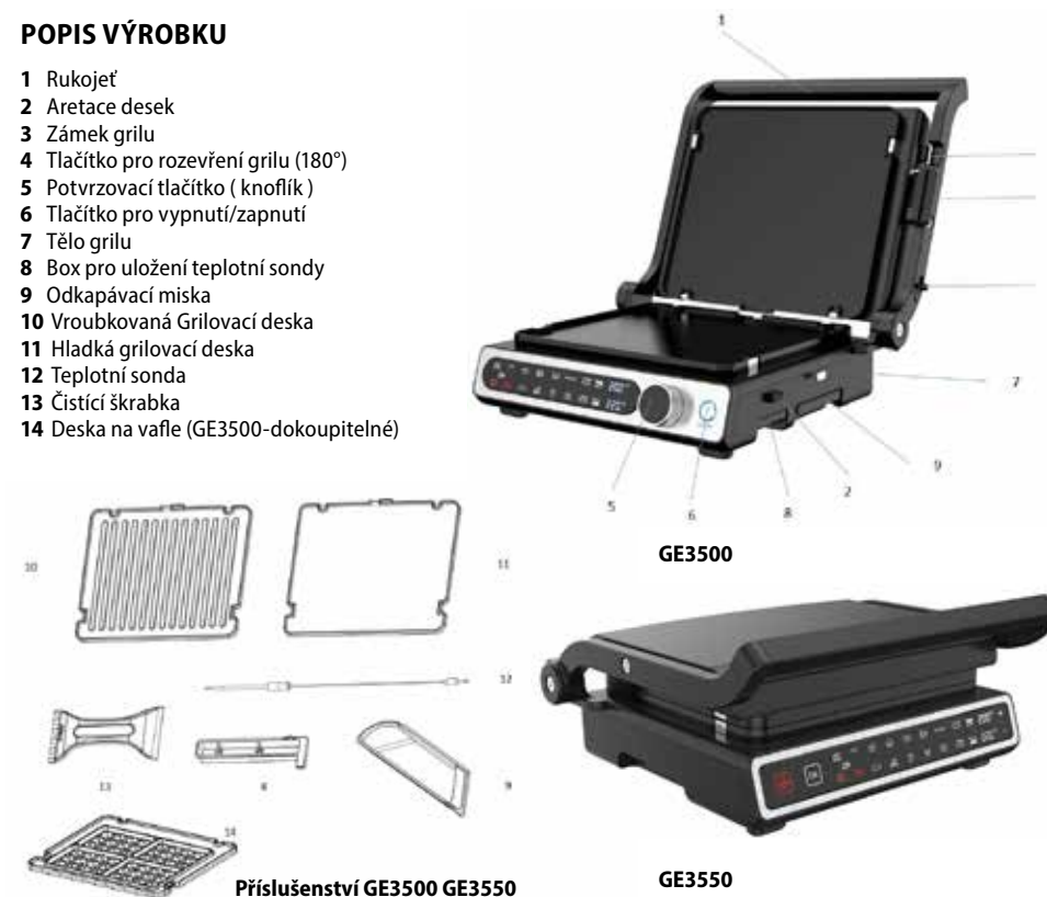
Příslušenství GE3500 GE3550