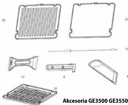
Akcesoria GE3500 GE3550