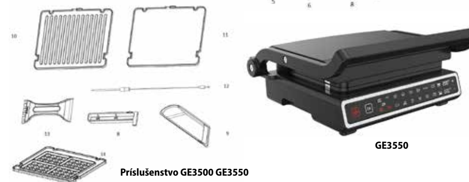
Príslušenstvo GE3500 GE3550