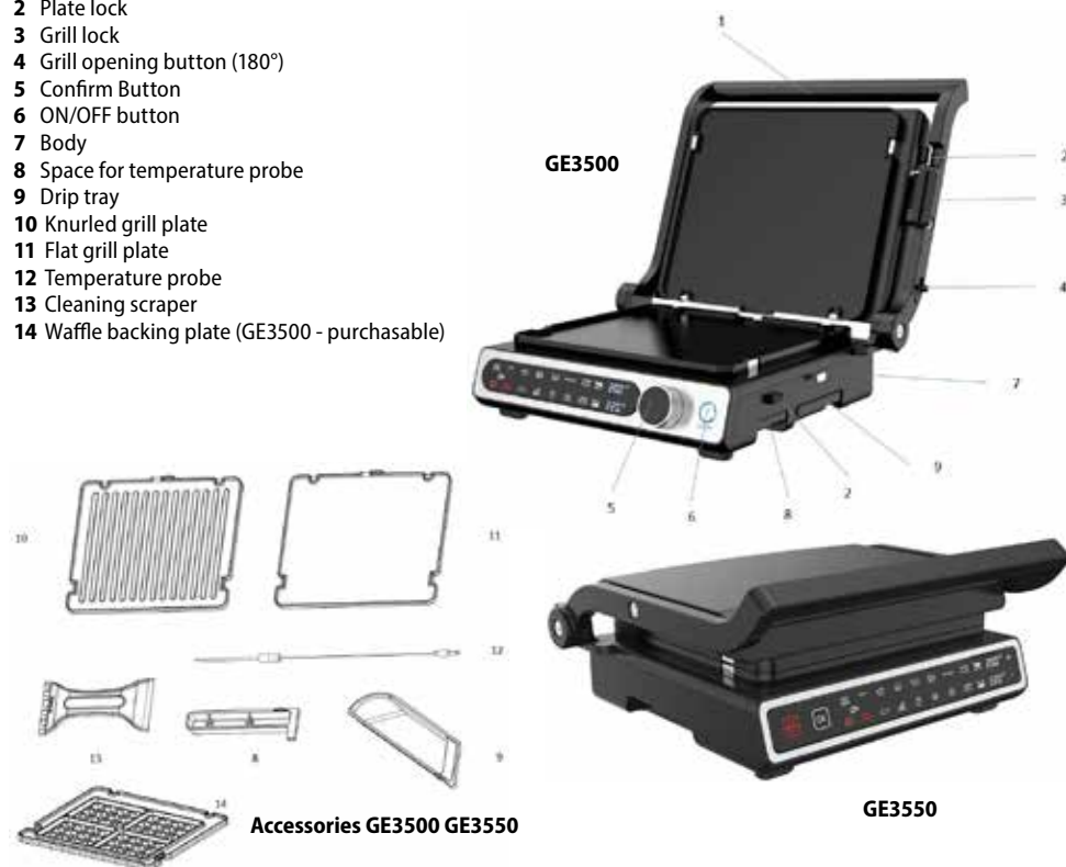
Accessories GE3500 GE3550